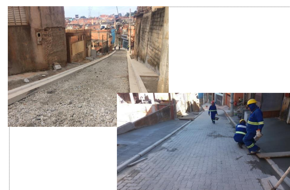
ENDEREÇO: RUA DOS MISSIONÁRIOS