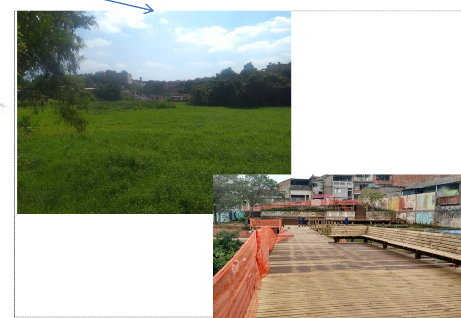
ENDEREÇO: PARQUE DAS GARÇAS PRATEADAS.