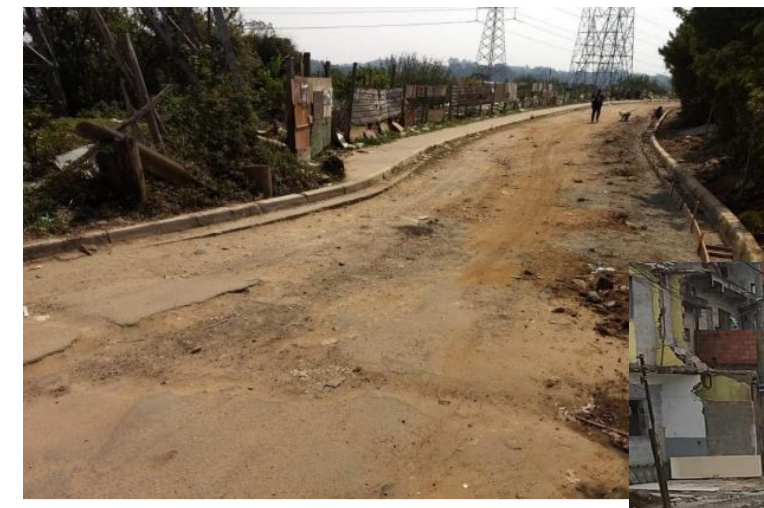
ENDEREÇO: RUA CLÁUDIO ARTÁRIA