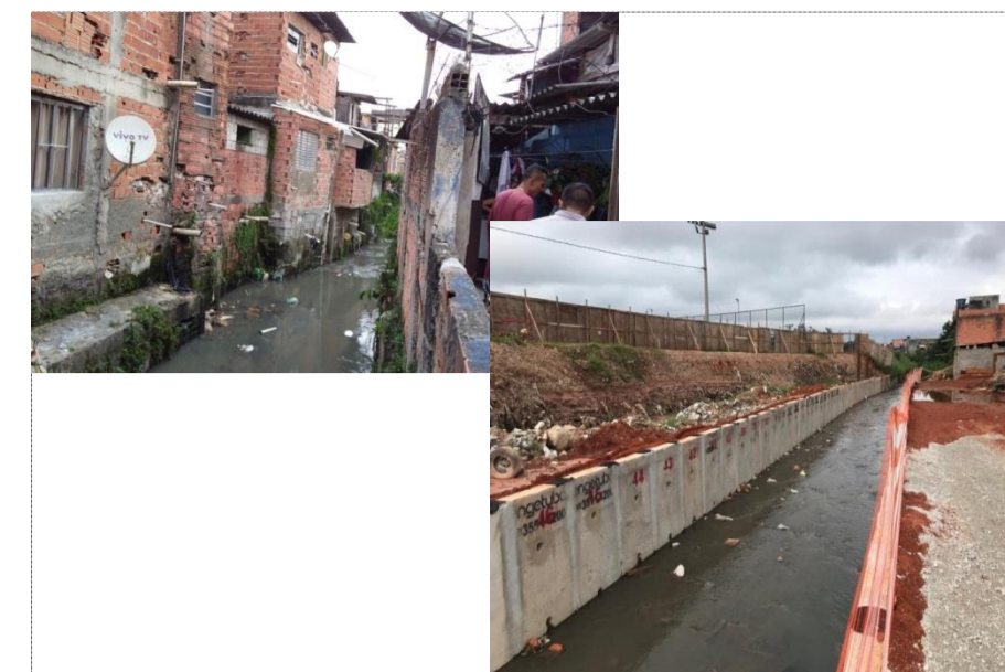
ENDEREÇO: CÔRREGO GUAICURI X AV. ANTONIO VIEIRA MARCONDES