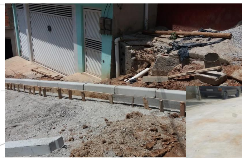
ENDEREÇO: RUA PROJETADA 4