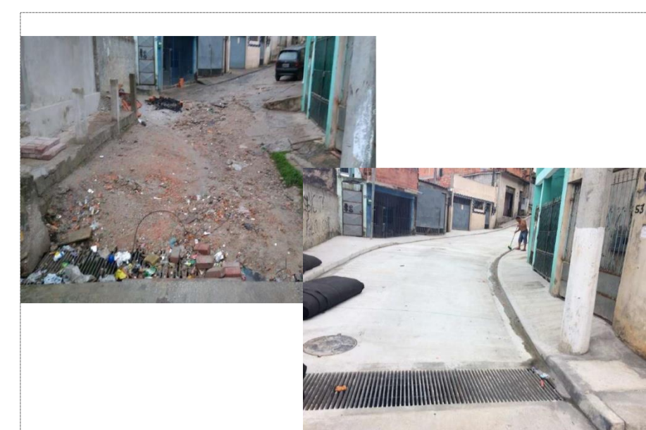
ENDEREÇO: RUA PRIMEIRO DE JUNHO