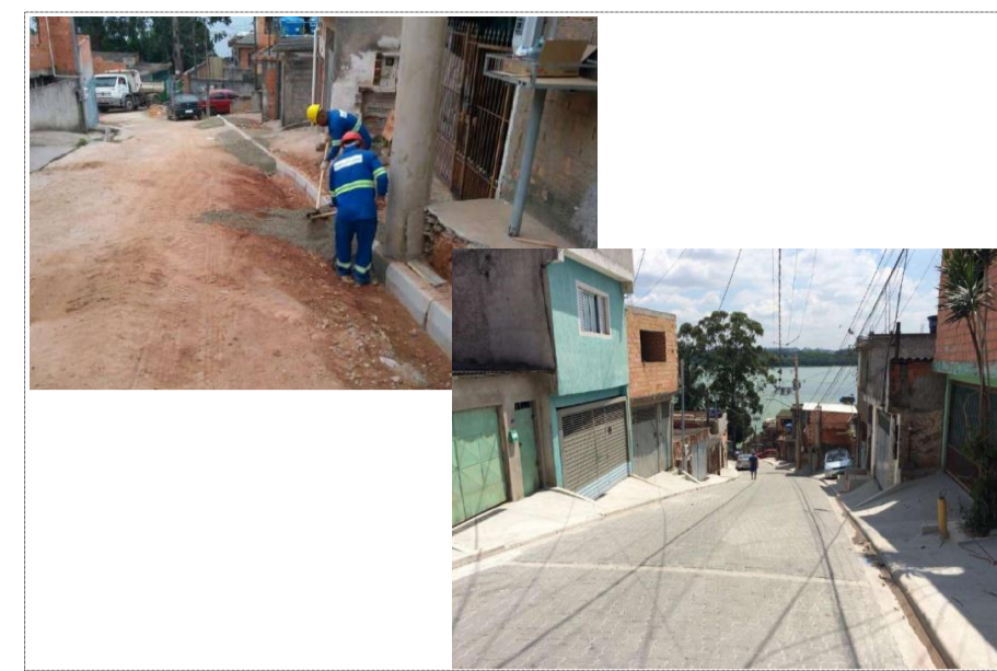
ENDEREÇO: RUA INÁCIO SOLANO