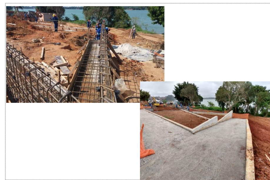
ENDEREÇO: RUA NOSSA SENHORA DE FÁTIMA